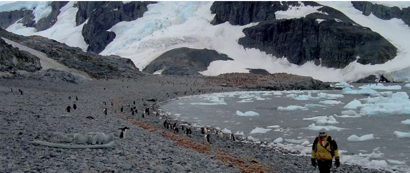
Playa de desembarco de la Isla Cuverville

Al final de la temporada (fase de muda), debido a la densidad de pingüinos las visitas probablemente se limiten a las inmediaciones de la playa de desembarco.